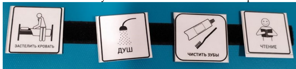
Рис.2 Расписание дня с карточкой «Чистить зубы»

• В течение дня обсуждать, что все чистят зубы, играть в чистку зубов куклам и игрушечным животным, читать книги о чистке зубов. Обсудить последствия отказа от чистки